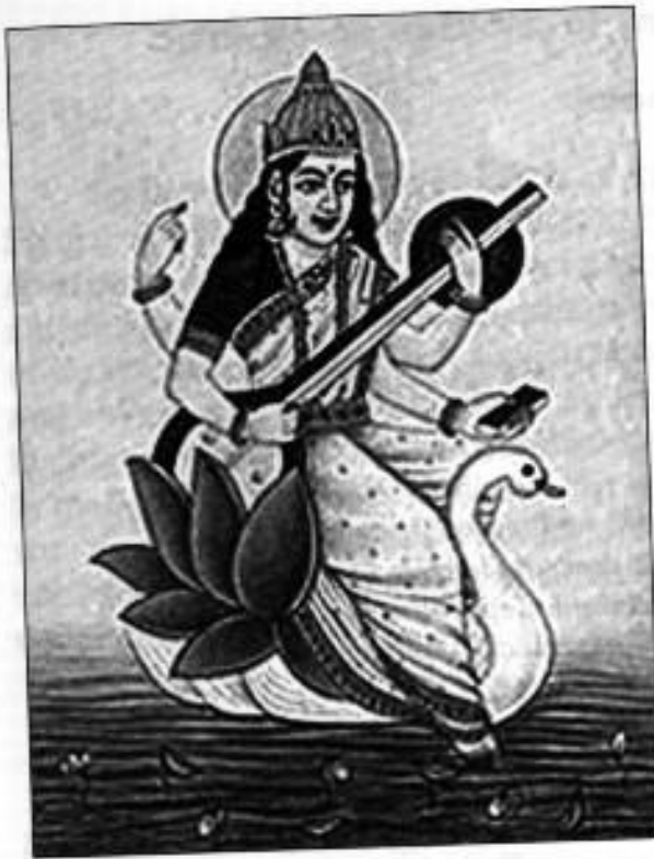
Ryc. 1. Bogini Saraswati

Lothal, Dholavira, Banawali) tworzących jedną z największych starożytnych cywilizacji. Badania archeologiczne wykazały, iż większość miast i osiedli cywilizacji Harappa położonych jest po wschodniej stronie Indusu w Pendżabie i Radżastanie. Ich lokalizacja nawiązuje do przebiegu Saraswati, która niegdyś przepływała przez te obszary i stanowiła kolebkę – jak niektórzy twierdzą – cywilizacji przewyższającej cywilizację Indusu. W tym ujęciu, Mohendżodaro i Harappa, wydają się być peryferyjnymi miastami znaczącej cywilizacji Saraswati. Jej największy rozkwit przypada między 3000 i 1700 BC. Pod koniec tego okresu, rzeka Saraswati zaczęła zanikać i wreszcie wyschła (Sankaran 1999). W obrębie jej dawnego koryta, zachowało się kilka jezior (Lunkaransar, Didvana, Sambhar, Ranns Jaisalmer, Pachpadra) – obecnie słonych – których osady denne świadczą o tym, iż były to niegdyś zbiorniki słodkowodne. Kilka innych rzek zmieniło wówczas swój bieg. Znaczna część niegdyś zielonego obszaru Radżastanu zamieniła się w suchą pustynię. Ludność związana z cywilizacją Saraswati zaczęła migrować w poszukiwaniu lepszych warunków życia kierując się głównie na wschód – do dorzecza Gangesu i Dżamuny oraz na południe – do dorzecza Godavari. Okres migracji ludów wiązano początkowo z inwazją Ariów, jednakże jest bardzo prawdopodobne, iż zasadniczym powodem upadku tej wielkiej cywilizacji było wyschnięcie rzeki Saraswati.